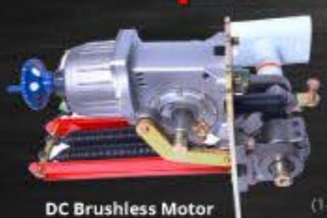
DC Brushless Motor