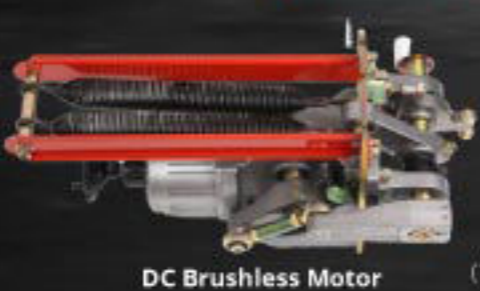
DC Brushless Motor