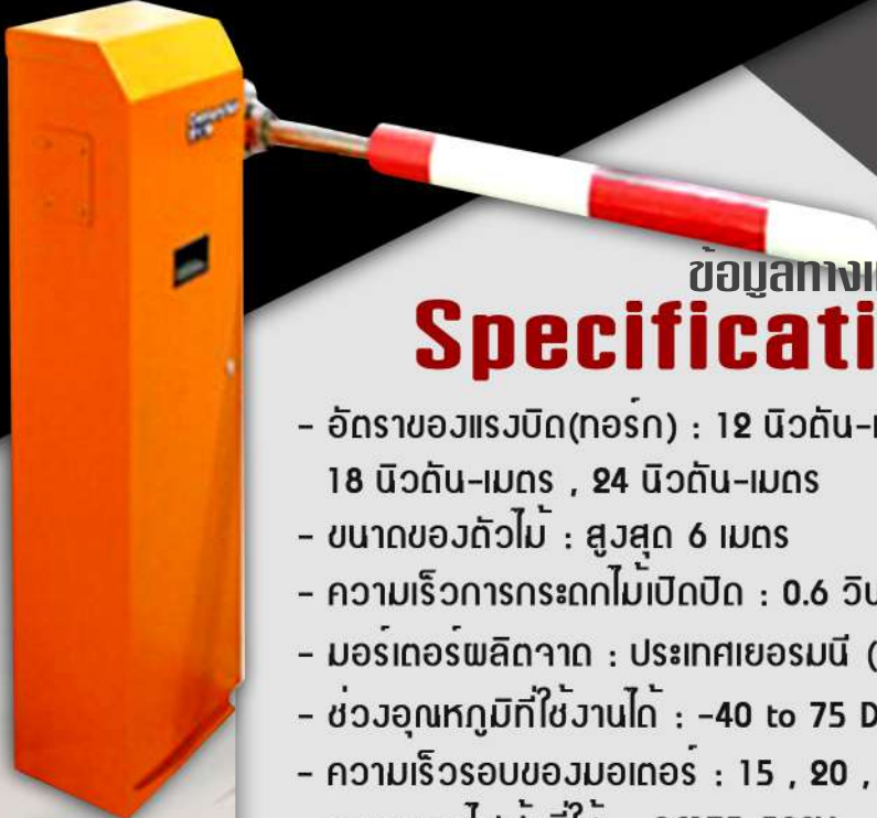
แขวนกั้นรถ Barrier Arm