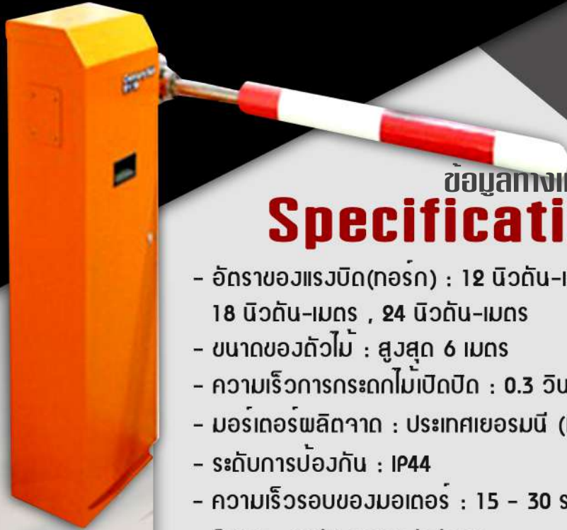
แขนกั้นรถ Barrier Arm