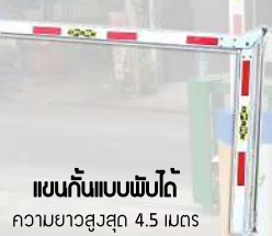
แขนกั้นแบบพับได้ ความยาวสูงสุด 4.5 เมตร